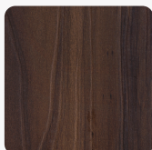
UNIVER SMART M025 CENTRAL MANHATTAN