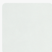
Bela D129 PS52 Površinska tekstura Quartz