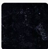
F065 PS57 MALKARA