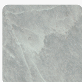
F047 PS80 SIVI MERMER Površinska tekstura Sjaj