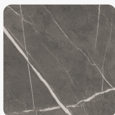
K4892 DP PIETRA GREY Površinska tekstura Duboko bojeno