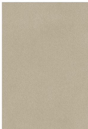
Slika cele ploče